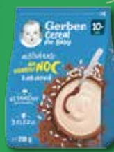
GERBER kaše 230 g, různé druhy