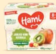
Hami 100% ovoce 4x 100 g