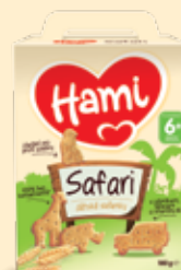
Hami Safari 180 g