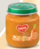
Hami příkrmy 125 g, různé druhy