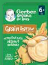
GERBER kaše 200 g, různé druhy