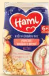
Hami Kaše 210 g, různé druhy